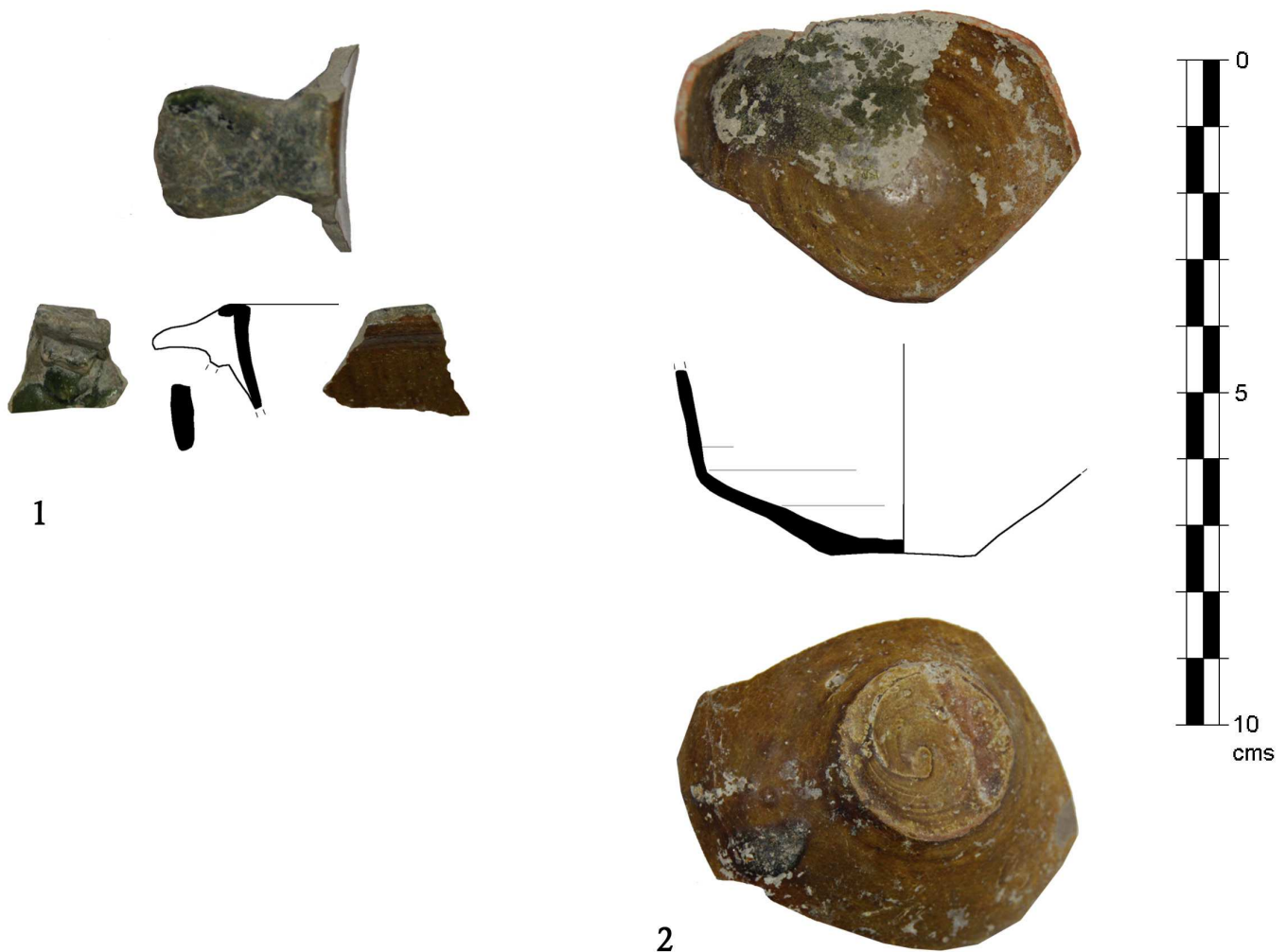
Figura 2. Escifo (nº 1) y taza (nº 2) en cerámica vidriada.

nadino Cerro de los Infantes, Cástulo o Sanlúcar de Barrameda, entre otros yacimientos (Beltrán 1990: 188, fig. 93, nº 844 y 845), incluyendo recientes estudios como el de la Casa del Mitreo de Mérida (Bustamante y Sabio 2011).