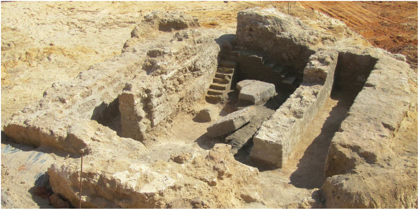
Figura 1. Vista general del edificio funerario (Estructura 8) excavado en la Avda. San Severiano 10, del cual proceden las cerámicas vidriadas.

En la necrópolis de Gades se conocen hallazgos previos de estas características, como sucede con el conocido escifo completo aparecido en 1939, y conservado en el Museo de Tetuán, procedente también de contexto funerario (Quintero 1942: 28, lam. LX, infra). Esta pieza, con vedrío verde y decoración a molde, es de similar tipología al ejemplar procedente de la U.E. 645-650 (Fig. 2, nº 1), tratándose de un asa circular con un aplique horizontal por encima, de sección rectangular, dando lugar a un vaso de borde plano exvasado al exterior, de extremo redondeado y que preludia un cuerpo de tendencia hemisférica poco acusada. Es un ejemplar realizado en serie, no muy cuidado, encontrándose el asa totalmente descentrada, y advirtiéndose una profunda digitación sobre el elemento de aprehensión superior; presenta pasta de coloración marrón clara a beige, con vedrío verde al exterior y melado sensiblemente jaspeado al interior; aspectos macroscópicos que en su momento llevaron a considerar la citada