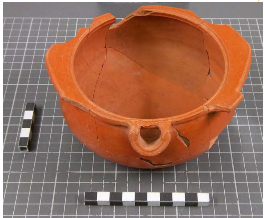
Figura 1 – Fotografía de la pieza.

En este lugar se halló un interesante contexto de amortización de una estancia que corresponde probablemente a un almacén, que al parecer se hallaba en el suburbium portuario de Dertosa. A lo largo de las paredes de dicha estancia se hallaron "in situ" una serie de cerámicas, que corresponden a diversas jarras intactas y dos ánforas béticas de la forma Beltrán 2, colocadas todas ellas cabeza abajo. Además de estos materiales, se halló una pequeña ánfora (también atípica desde el punto de vista formal) de origen siciliano, una anforita bética de la forma Dressel 20 en miniatura, así como terra sigillata hispánica (formas Hispáni-