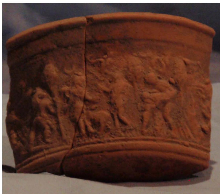
Fig. 1. Fragmento de cuenco de cerámica corintia romana, de la forma Spitzer1942 fig. 122, de la villa romana de Els Masos (Cambrils)

Esta cerámica en Hispania tiene una distribución claramente mediterránea, pues aparece en Ampurias, Gerona, Barcelona y Tarragona, en Cataluña; Pollentia (Alcudia) y el pecio de Porto Pi (Mallorca), en las Baleares; y más al sur, en las costas valenciana, murciana y andaluza, se documenta en el Portus Illicitanus (Santa