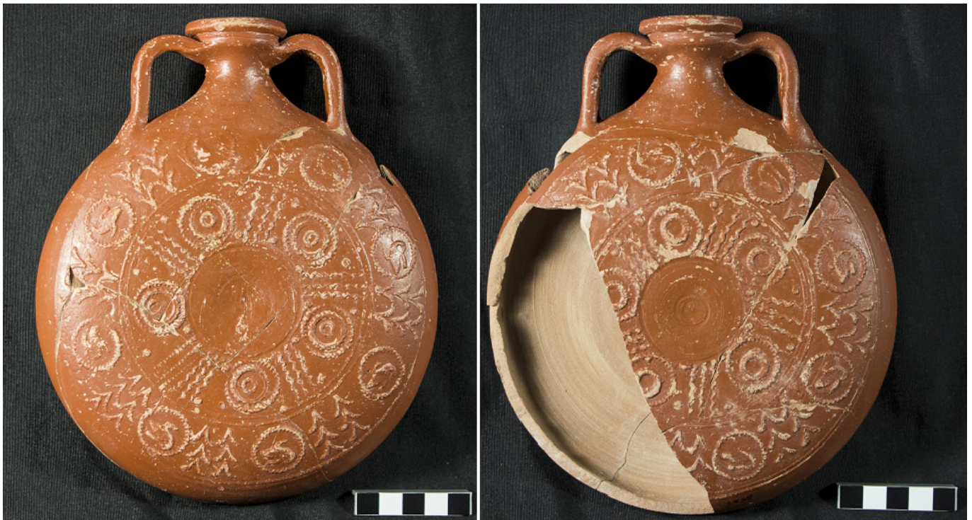
Figura 2. Fotografía de las caras A y B de la cantimplora Hermet 13 (autor: Ramón Álvarez Arza)

vos vegetales (palmas, hojas de hiedra), figuras geométricas y cierto número de representaciones onomásticas.