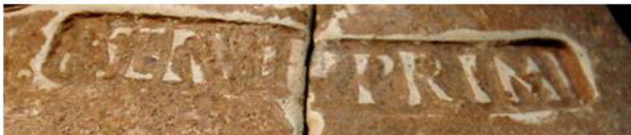
Fig. 3. Detalle del sello de taller P. SERVILI PRIMI situado bajo el arranque del cuello

Durante el proceso de catalogación hemos consultado con especialistas del Institut Català d'Arqueologia Clàssica (ICAC) dicha marca ya que no habíamos hallado paralelos, indicándonos que se trataba de una marca inédita, y ajustando la tipología y cronología, correspondiendo a un ánfora Dressel 3, que se dataría en el primer tercio del siglo I d.C. considerando interesante darla a conocer 1