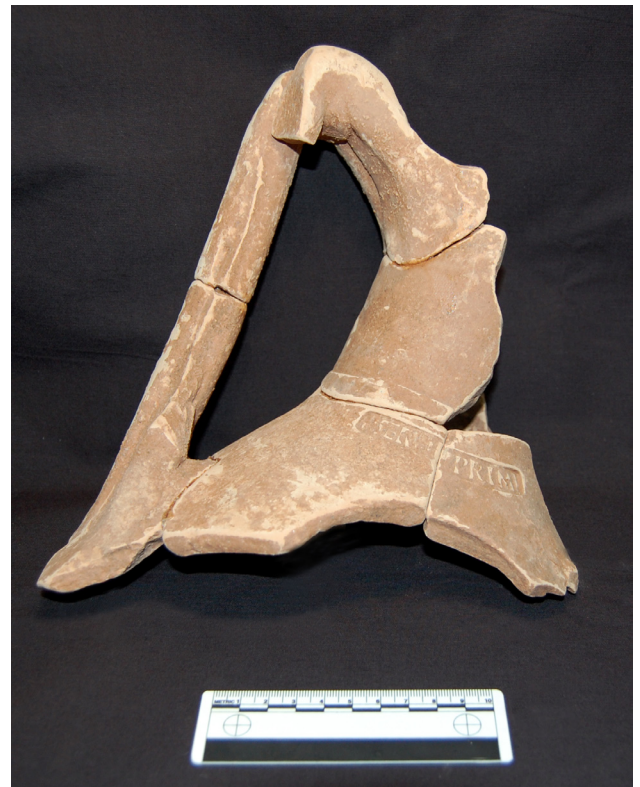
Fig. 1. Ánfora Dr. 3 procedente de la villa romana de Vinamargo (Castelló)