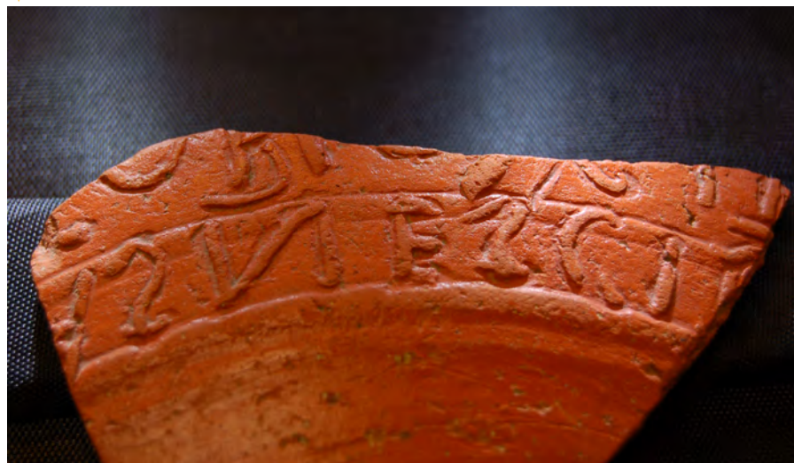
Fig. 1: Fragmento de TSHT con inscripción a molde procedente de Papatrigo (Ávila) (Dibujo de Emilio Rodríguez Almeida y Pilar Oñate Baztan).