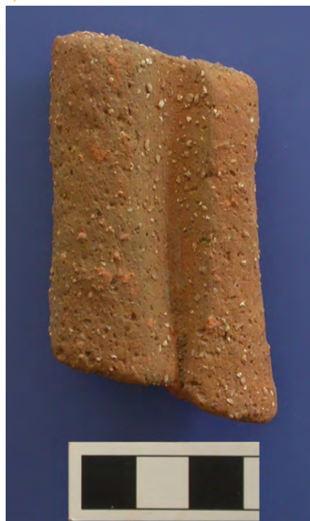
Figura 1 - Fotografía y sección del fragmento estudiado (fuente: Roberta Tomber).

WILLIAMS y PEACOCK, 2001) especialmente de procedencia itálica (forma Dressel 2-4) y algunas ánforas béticas (Dressel 7-11 y 20). La mayoría de estas ánforas se fecha en época de Augusto y durante la primera mitad del siglo I d.C., época en que se produjo un importante auge comercial entre Oriente y el Imperio romano. El principal centro parece haberse hallado en Arikamedu, donde se instaló una colonia de comerciantes procedentes del Imperio, posiblemente itálicos.