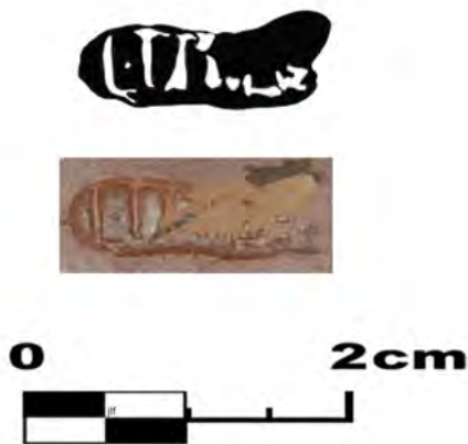
▲ Fig. 2: Detalle del sigillvm p.p. de L.TIT(I).

dose catorce tumbas y dos construcciones: un vstrinum de planta elíptica donde se incineraban los cadáveres, abundantes manchas de cenizas y un túmulo de planta cuadrada que alberga seis de las tumbas documentadas. Las demás tumbas descubiertas estaban enterradas en los alrededores de las construcciones descritas. También fueron documentados dos muros de otros complejos anexos.