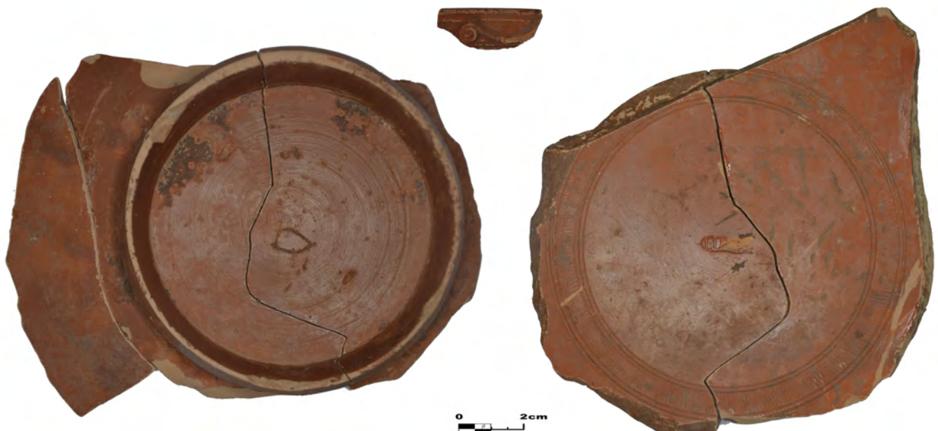
Fig. 1: Detalle del fondo (externo; a la izquierda; interno, a la derecha) del plato de TSI utilizado como tapadera de la urna funeraria.

Se han realizado sucesivas campañas de excavaciones arqueológicas desde 1985, pero sin haber hallado la necrópolis de este oppidum . La ahora detectada se encuentra tan sólo a 222 m al E de las murallas orientales, en zona de vega visible desde la ciudad. El cauce del río Jabalón separa el ámbito funerario del poblado. Las investigaciones desarrolladas han permitido recuperar materiales de una necrópolis de incineración, descubrién-