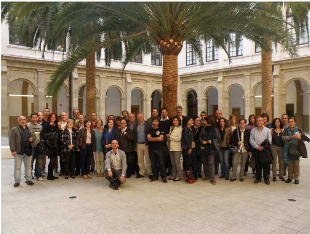
Algunos participantes de la Mesa Redonda